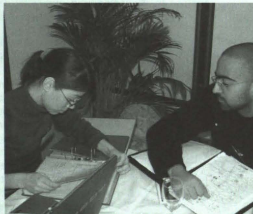
General Conference 2004 in Wien – Unsere National Secretary (li.) im harten Verhandlungspoker um Praktikumsplätze mit Tunesien

Inffeldgasse 16/b im Erdgeschoss Sprechstunden: Di, 11:00 – 12:00 www.graz.iaeste.at