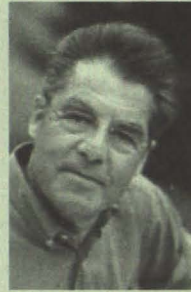
Dr. Heinz FISCHER