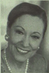
Dr. Benita FERRERO-WALDNER