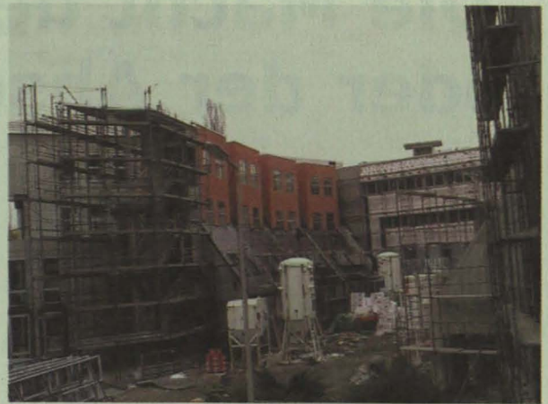
das Studienzentrum ist noch eine Baustelle

„Es soll, nein, es darf an der TU Graz bei keinem Sekretariat, bei keinem Dekanat und bei keinem Universitätslehrerzimmer einen Knauf an der Tür geben. Nur Türklinken sollen erlaubt sein.“