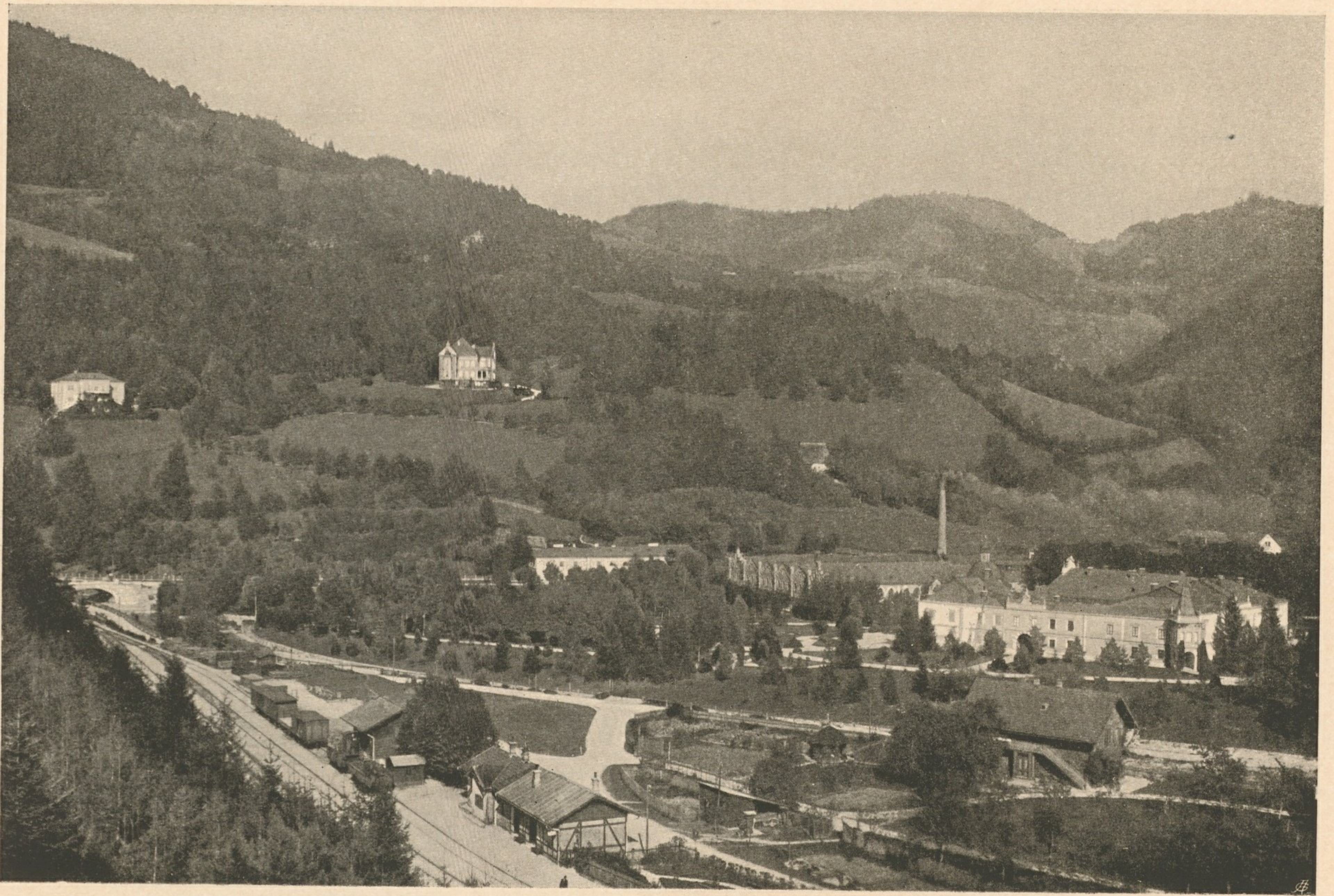
Nr. 61. Neubruck an der Erlauf.