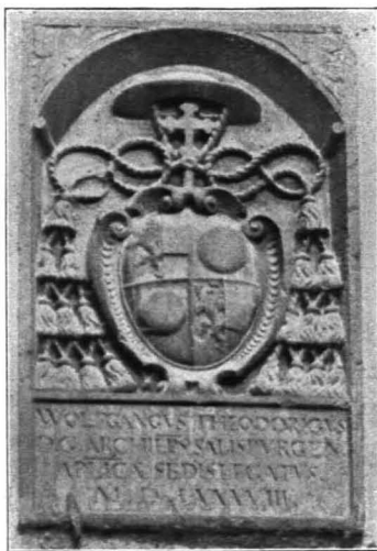
Fig. 95 Hohensalzburg, Wappen des Erzbischofs Wolf Dietrich am Schlangensrondell (S. 83)