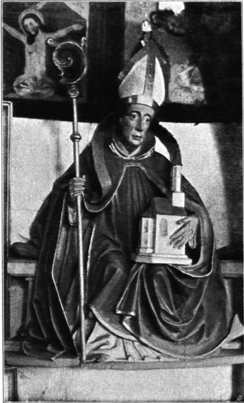
Fig. 209 Groß-Gundholz, spätgotische Holzstatue eines hl. Bischofs (S. 241)