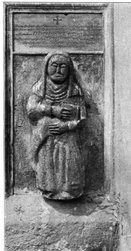
Fig. 213 Kirchbach, Pfarrkirche, Grabstein einer Nonne (S. 244)

Kanzel: Holz, polychromiert. An der Brüstung vier barocke, lebhaft bewegte Statuen der Evangelisten, auf dem Baldachin guter Hirt, alle fünf Holz, neu polychromiert, mittelmäßig. Erste Hälfte des XVIII. Jhs.