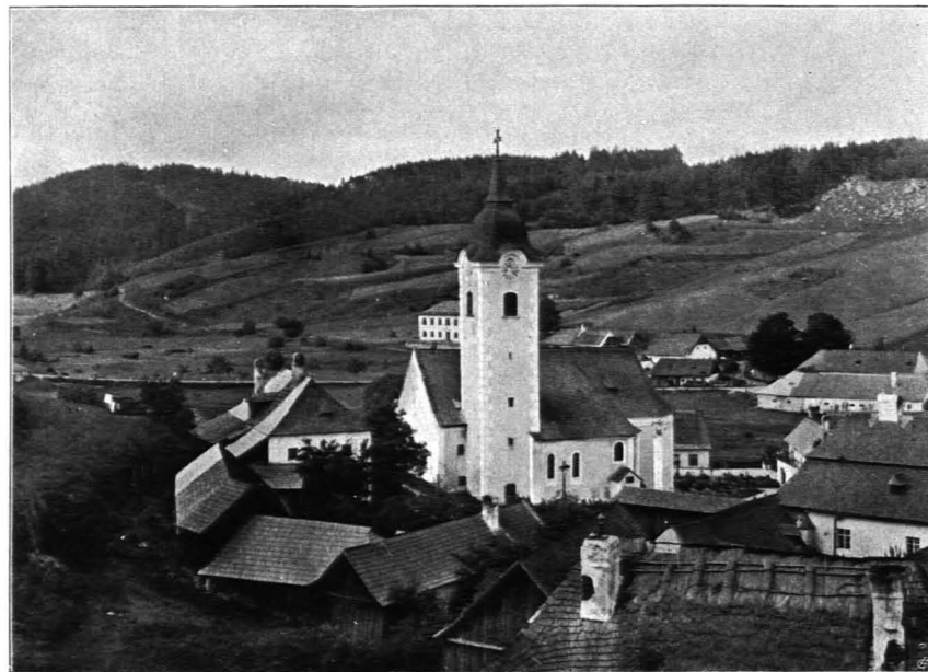
Fig. 210 Kirchbach, Pfarrkirche, Ansicht von Südwesten (S. 242)