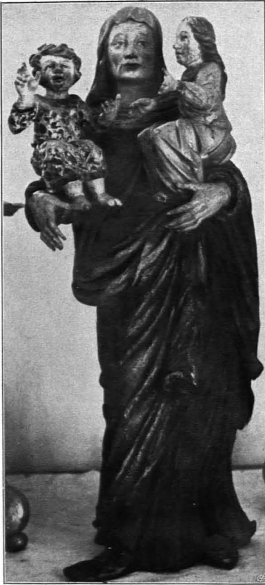
Fig. 588 Schloß Greillenstein, Kapelle, Hl. Anna selbdritt (S. 496)

Querband enthält zwischen Füllhörnern je ein Rundmedaillon mit einem Engel in Landschaft; der eine mit Totenkopf, beziehungsweise Memento mori, der andere mit einem Bilde des Jüngsten Gerichtes und Beischrift: Memorato novissima . In beiden Medaillons kleines Täfelchen mit Monogramm P C V .